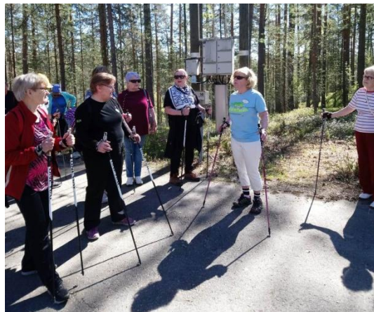
Retkellä Kruunupuisto Punkaharju